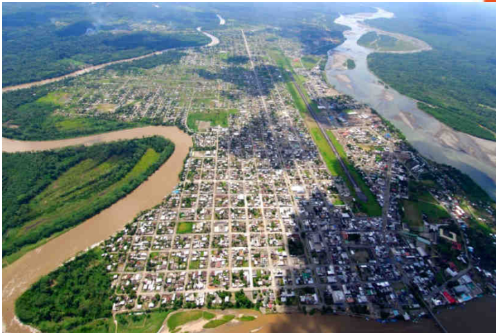
Vista aérea del Coca