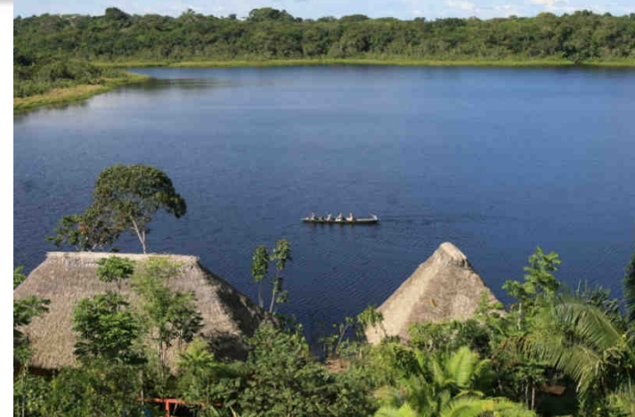
Laguna Añangu Cocha