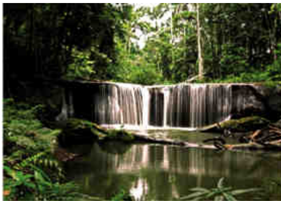
Cascada la Belleza